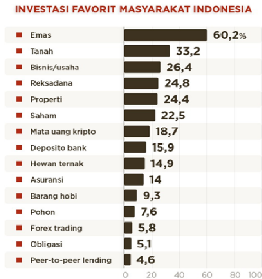
Gambar 1 Jenis Investasi Favorit Masyarakat Indonesia